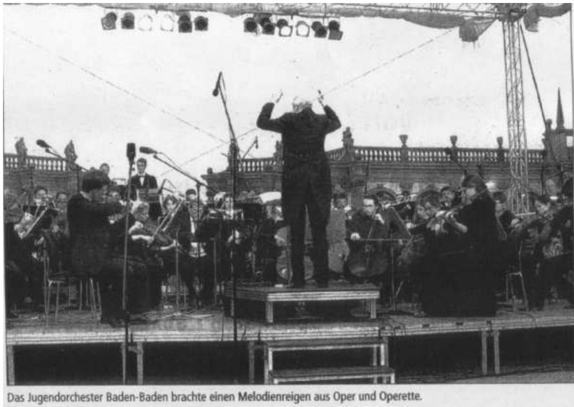
Das Jugendorchester Baden-Baden brachte einen Melodienreigen aus Oper und Operette.